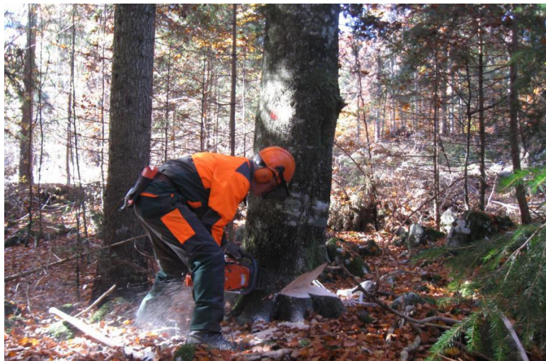
Varnost pri delu v gozdu na prvem mestu

Delo, ki ga opravljamo v gozdu, sodi med bolj nevarna dela. Podiranje in spravilo drevja oziroma lesa je med najbolj nevarnimi poklici in v primeru nesreče so poškodbe zelo hude, pogosto tudi smrtne. Poklicni sekači imajo opravljeno ustrezno šolanje in številne tečaje, poleg tega pa imajo veliko prakse, saj v gozdu delajo tako rekoč vsak dan. Drugače pa je pri tistih lastnikih gozdov ali njihovi družinski članih, ki to počno občasno, nimajo ustrezne prakse in usposobljenosti za delo v gozdu.