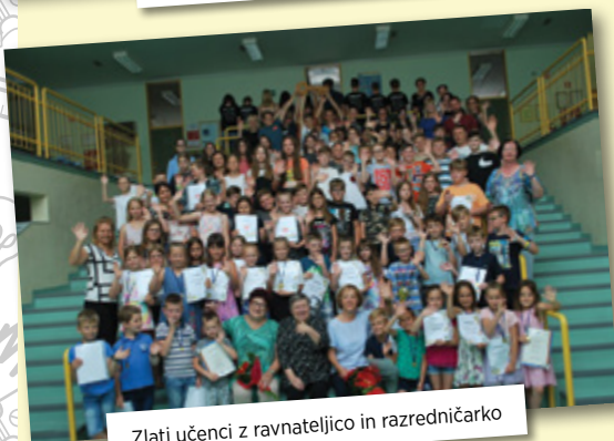
Zlati učenci z ravnateljico in razredničarko