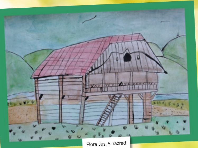
Flora Jus, 5. razred