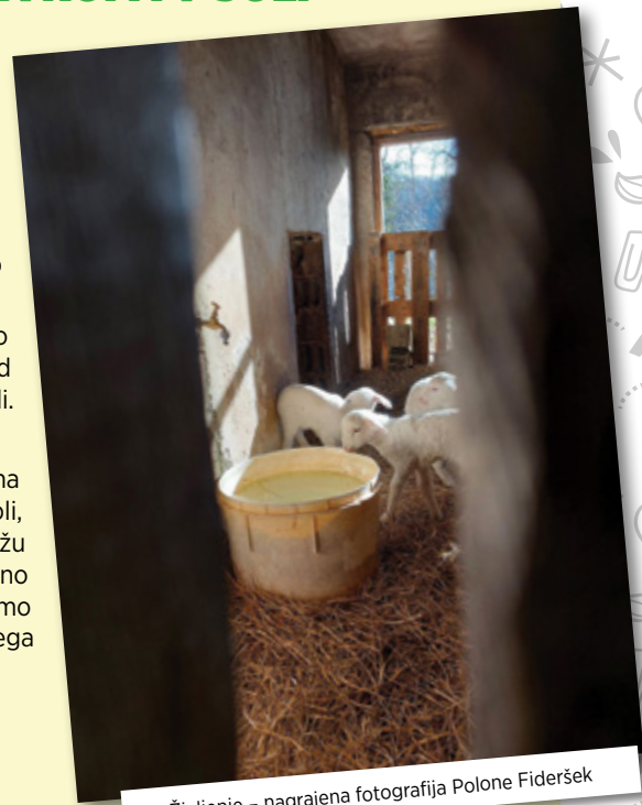
Življenje - nagrajena fotografija Polone Fideršek