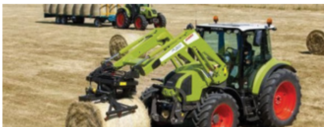
Slika 2, vir deutzfahr trak

Vse preveč je primerov, ko obdelovalci kmetijskih površin in izvajalci gozdarskih opravil v vlogi voznikov s traktorji na ceste nanesejo zemljo ali blato, ki onesnaži vozišče javne ceste.