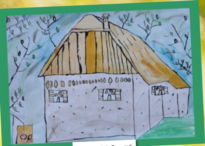
Denisa Zajšek, 5. razred