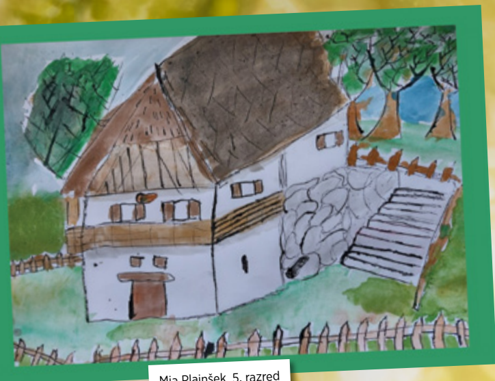
Mia Plajnšek, 5. razred