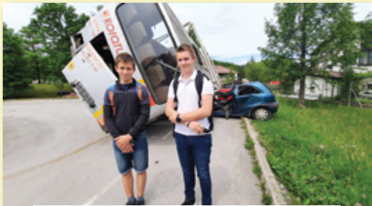
Na ogledu poligona Izobraževalnega centra URSZR na Igu