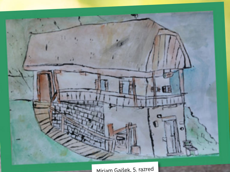
Mirjam Gajšek, 5. razred