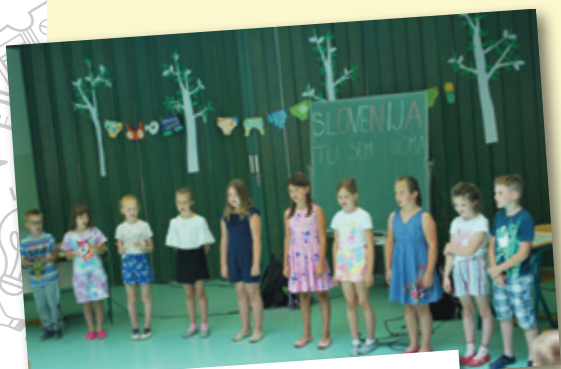
Utrinek z nastopa