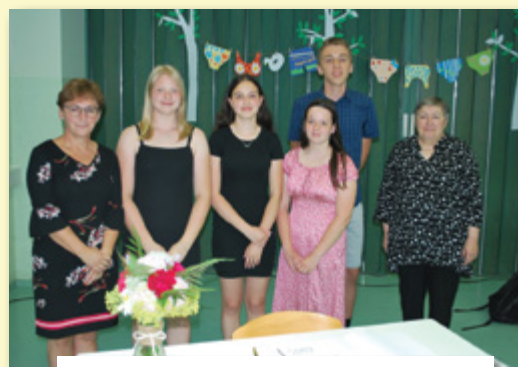
Skupinska fotografija za slovo