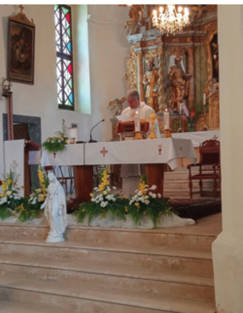
Župnik Viki Košec