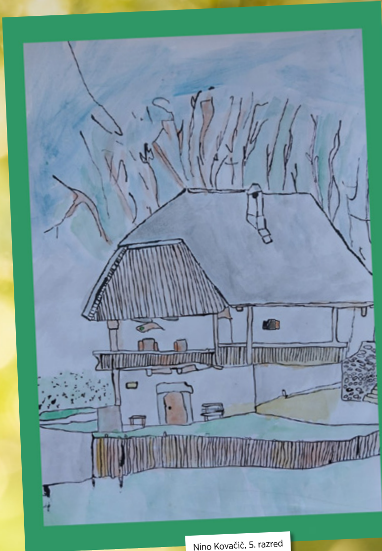
Nino Kovačič, 5. razred