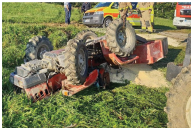
Slika 1, vir prlekija -on.net

Ob tem vozniki traktorjev premalo pozornosti namenjajo tlaku v pnevmatikah in se ne zavedajo, da imajo klasične traktorske pnevmatike za delo na kmetijskih površinah precej slabši oprijem na asfaltu. Ena od največjih nevarnosti preži pri zaviranju na površinah z različnim oprijemom, kar se v praksi nemalokrat zgodi pri umikanju s ceste na bankino. Če pri zaviranju pogonski kolesi blokirata na različnih podlagah - eno na peščenih bankini in drugo na asfaltu - se traktor lahko hitro prevrne.