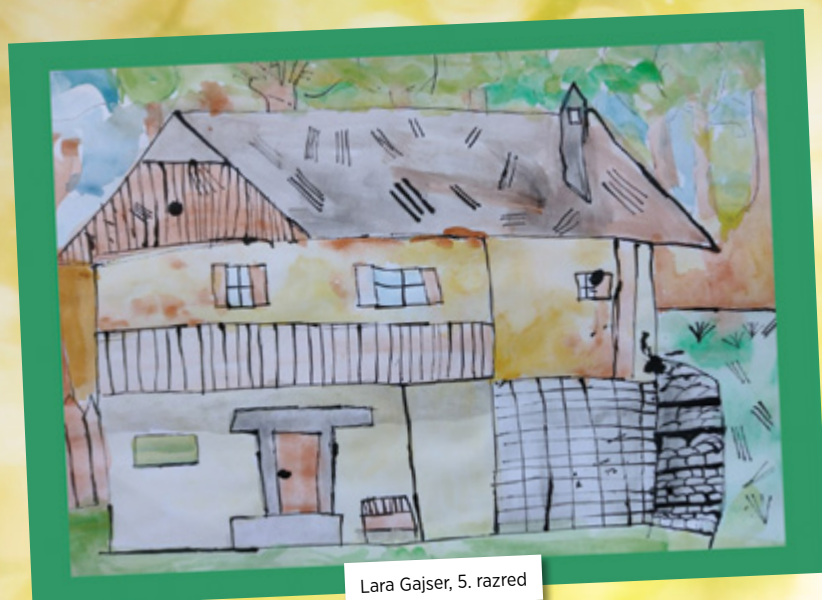
Lara Gajser, 5. razred