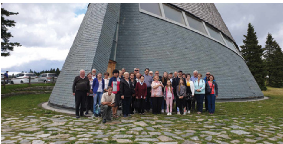
Pred cerkvijo na Rogli

Sprehodili smo se po travnati površini; v posebni sobi je prodajalna zeliščnih likerjev in drugih proizvodov, degustirali smo zeliščne napitke in kupili kaj zdravilnega za na pot. V kletnem prostoru nam je prikazal keramičar, kako nastane lonec iz gline.