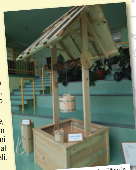
Mladi raziskovalci kulturne dediščine in njihovi izdelki