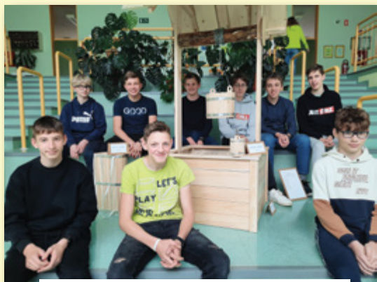
Mladi raziskovalci kulturne dediščine in njihovi izdelki