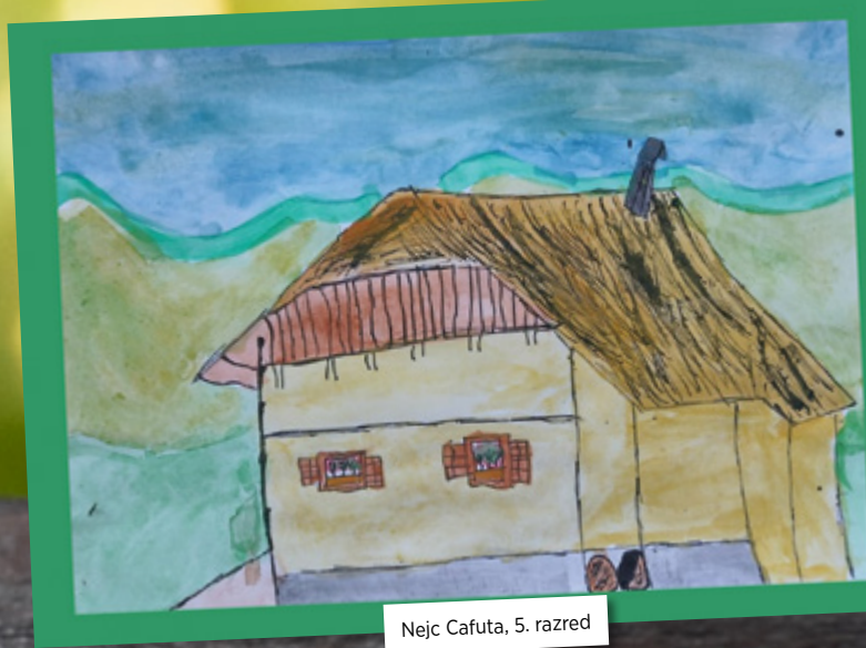
Nejc Cafuta, 5. razred